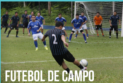
FUTEBOL DE CAMPO