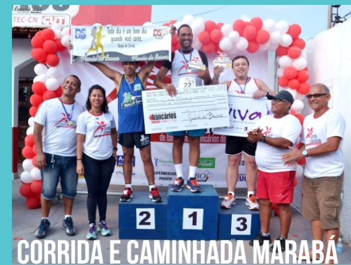
CORRIDA E CAMINHADA MARABÁ