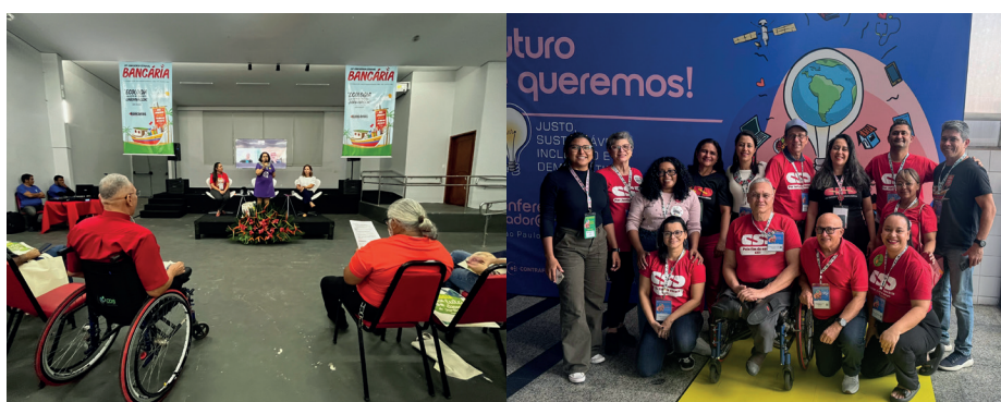
Conferência Bancária Estadual e Nacional serão parte das atividades pré-Campanha

“É na Conferência Estadual que a nossa delegação é eleita para representar os trabalhadores e trabalhadoras do Pará na 28ª Conferência Nacional dos Bancários e Bancárias, e também nos Congressos Nacionais do BB e da Caixa que ocorrem em junho em São Paulo. Por isso é importante a participação